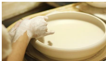
①陶芸家によるモデルの制作