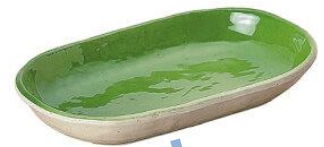
③陶磁器の風合いのある樹脂食器の成形