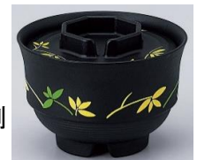
⑤-3.SPS樹脂:スクリーン/PAD印刷