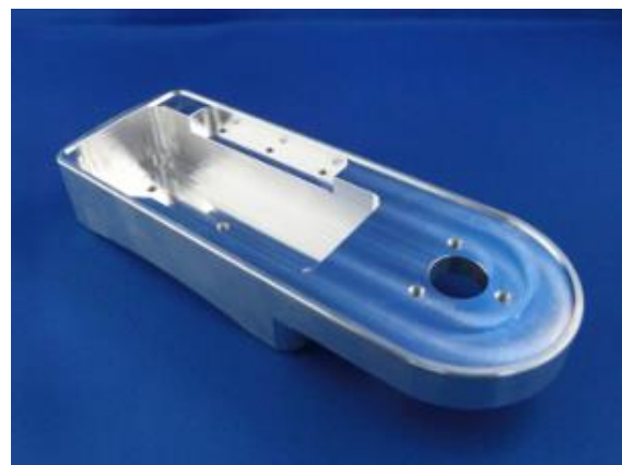
医療用機器部品加工サンプル