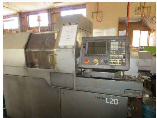
主軸台移動形CNC自動旋盤

アーム アウトサートナット インサートナット ウェイト 押釦 オリフィス ガイド カシメピン カム カムローラー カテーテル カバー ギアブランク キャッチ キャラクター ケース コア 小ネジ コンタクト 軸 シャッターピン 支柱 シャフト ジョイント シリンダ スタッド ストッパー スペーサー スライド スリーブ セットビス 絶縁座 潜望鏡 ターミナル 端子 タンポ チップ ツマミ テーパーピン 鉄芯 電極 止メネジ ナット ニップル ノズル パイプ ハンマー ビス ピストン ピン プーリー ブッシュ プラグ フランジ 噴口 ホルダー ボディー ポペット モール ライナーヌキ リベット リング レバー ローラー ロール ワイヤー止メ