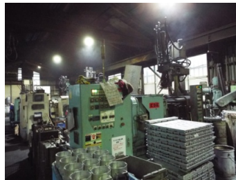
ダイキャスト工場(125t ～300t鑄造機保有) +