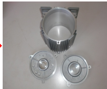
完成品(モーター外装部品)