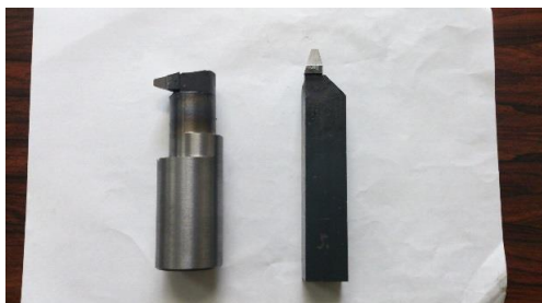
社内で製作した工具