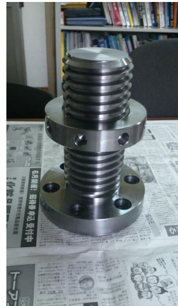
完成した製品 (ボルト・ナット)